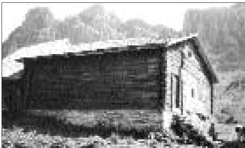
Il «Huis», la chasa-cumin dals Gualsers da Palfris, bajegiada l'onn 1409.